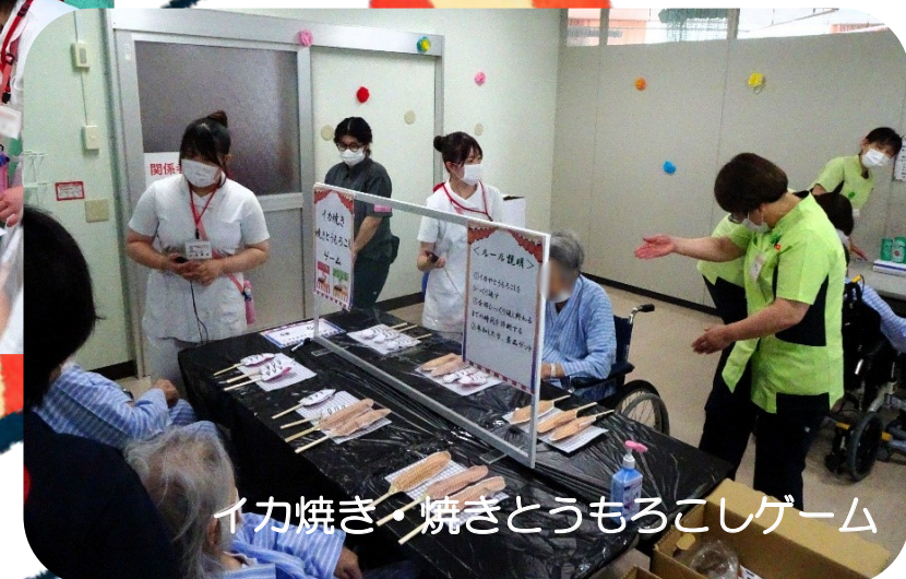
イカ焼き・焼きとうもろこしゲーム